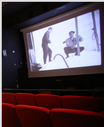
↑ Salle de cinéma du Téléphérique