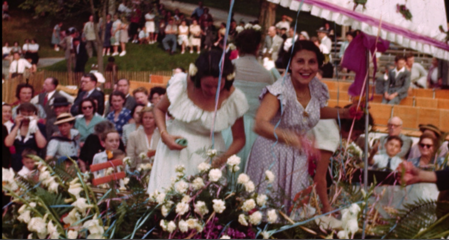
Fonds Jean Longhi, Collection Archives départementales de Savoie