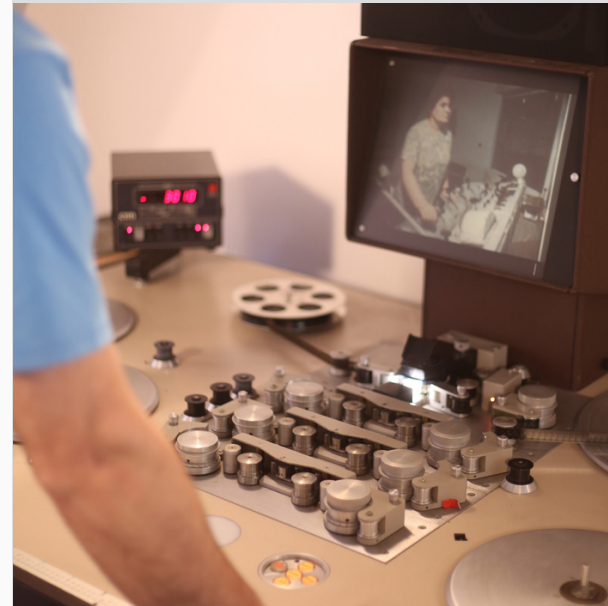
↓ Scanner de numérisation

La sauvegarde des fichiers se fait sur serveur à demeure et à distance, mais aussi sur supports physiques (bandes LTO). Les originaux sont conservés aux Archives départementales partenaires.