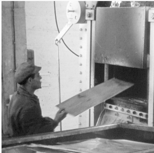
↑ Fonds Xavier Béchu, Collection Archives départementales de Savoie