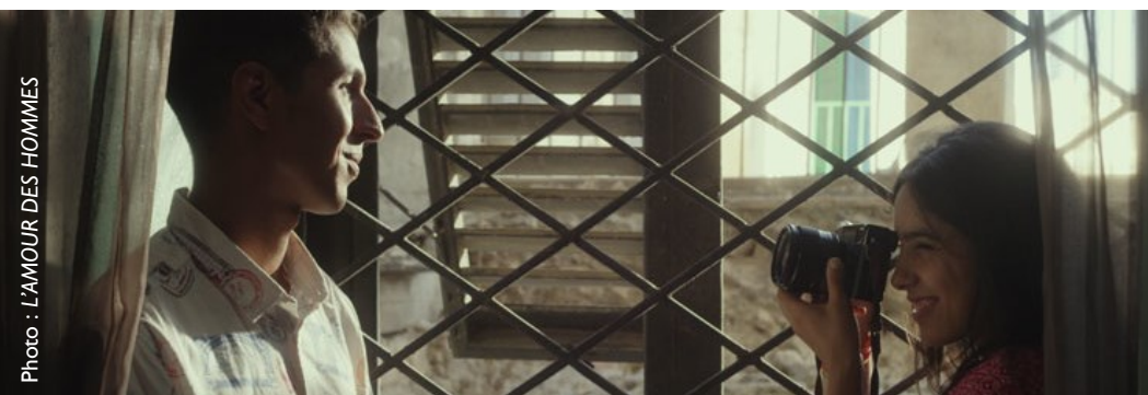
Photo : L'AMOUR DES HOMMES

En attendant les Hirondelles - MJC Novel - 18H00