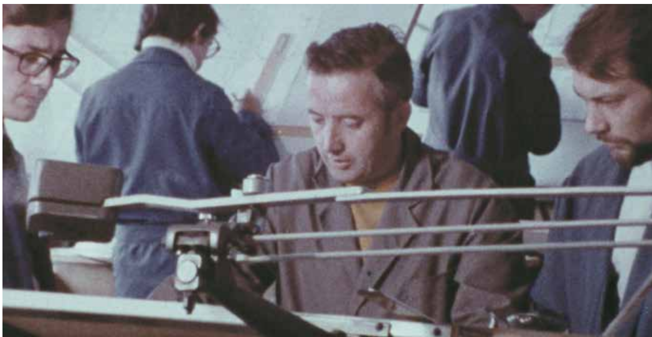
« SNR Roulements » de Jean Salvy, Fonds NTN-SNR, Collection Archives départementales de Haute-Savoie

Les réalisations audiovisuelles résultant du projet ENTRE2PRISES viennent en soutien des industries dans leur stratégie de recrutement. Les réseaux professionnels et groupements d'entreprises peuvent aussi les utiliser pour leur communication. Lieux d'accueil du public et temps de présentations peuvent être enrichis de cette matière nouvelle. Les partenaires prennent connaissance des ressources de la CPSA pour alimenter en images leurs stratégies de contenu.